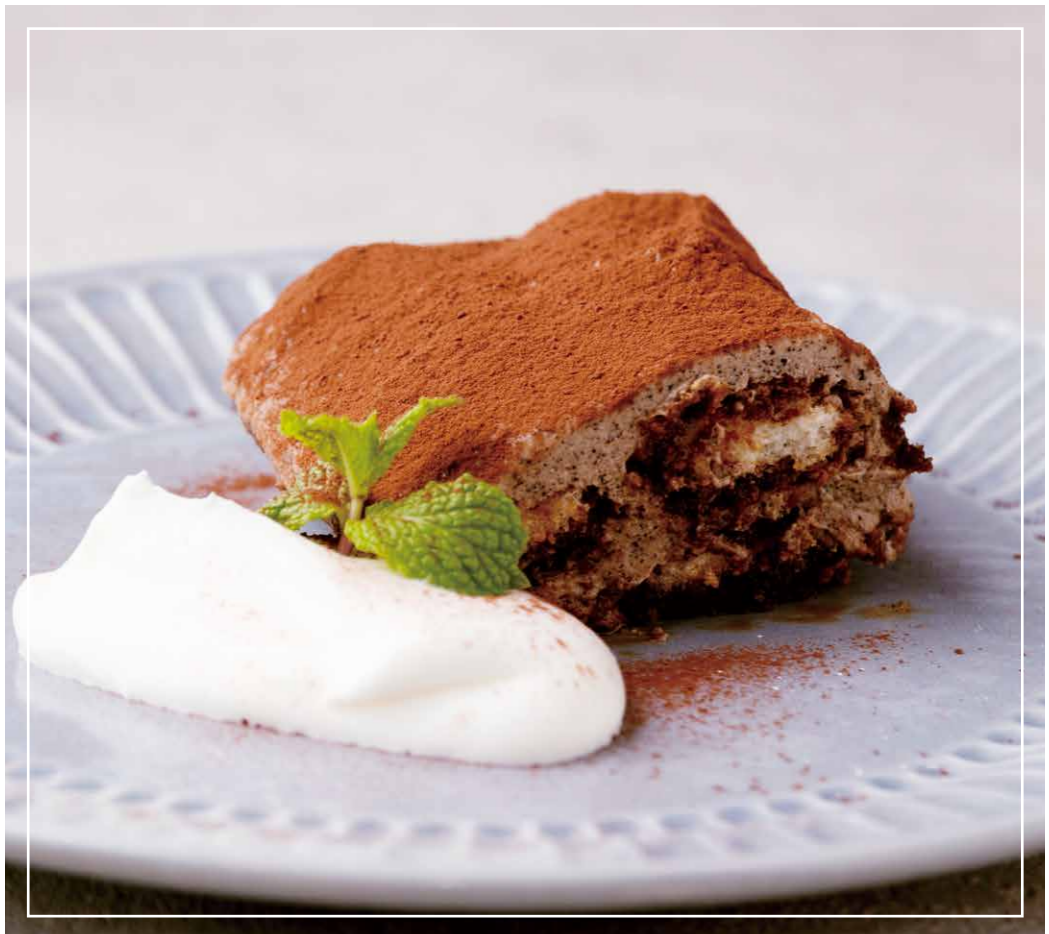
HOMEMADE TIRAMISU 自家製ティラミス ¥737 (税込 ¥810)

ココアを練り込んだしっとりフワフワな生地に たっぷりのシャンティークリームとショコラソース。