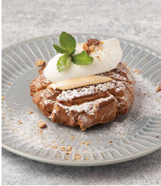
PIE CHOU À LA CRÈME ¥682 (税込 ¥750) パイシュー

チーズをたっぷり使った濃厚な味わい。 バニラ香る甘さ控えめの大人のチーズケーキ。