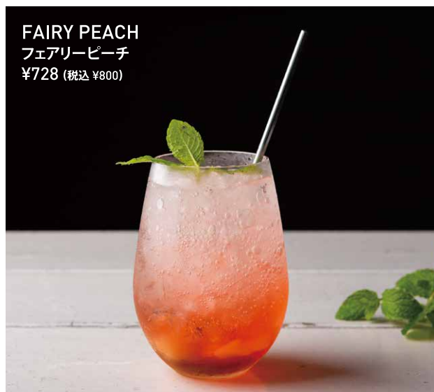
FAIRY PEACH フェアリーピーチ ¥728 (税込 ¥800)