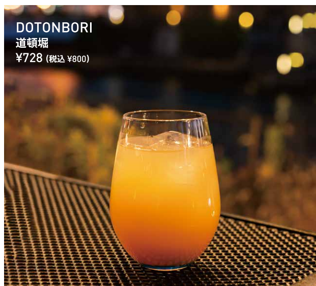
DOTONBORI 道頓堀 ¥728 (税込 ¥800)