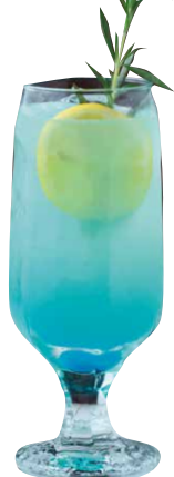
グラデーション ノンアルカクテル