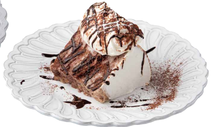
ANGEL FOOD CAKE CHOCOLATE エンゼルフード ショコラ ¥637 (税込 ¥700)

しっとりフワフワ真っ白な生地に、 たっぷりのシャンティークリームとキャラメルソース。 ボリューム満点の人気スイーツ!