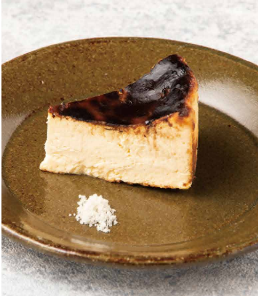
BURNT CHEESECAKE ¥682 (税込 ¥750) バスクチーズケーキ

チーズをたっぷり使った濃厚な味わい。 バニラ香る甘さ控えめの大人のチーズケーキ。