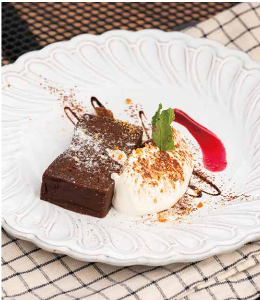
CHOCOLAT TERRINE ¥682 (税込 ¥750) ショコラテリーヌ

オーダーが入ってからシューを焼きパイ生地サクサク食感と たっぷりの濃厚カスタードでボリューム満点!