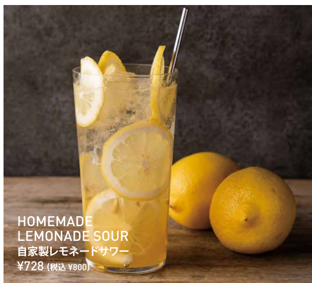
HOMEMADE LEMONADE SOUR 自家製レモネードサワー ¥728 (税込 ¥800)