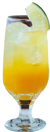
パッションマンゴー