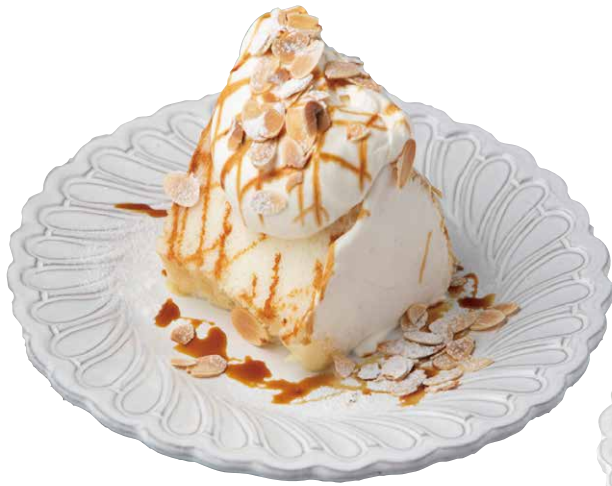
ANGEL FOOD CAKE VANILLA CARAMEL エンゼルフード バニラキャラメル ¥637 (税込 ¥700)

しっとりフワフワ真っ白な生地に、 たっぷりのシャンティークリームとキャラメルソース。 ボリューム満点の人気スイーツ!