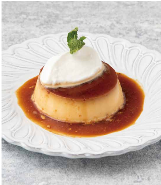
CRÈME CARMEL ¥682 (税込 ¥750) クレームキャラメル