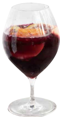
ノンアルサンテリア