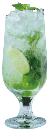
ヴァージンモヒート