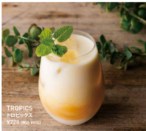
TROPICS トロピックス ¥728 (税込 ¥800)