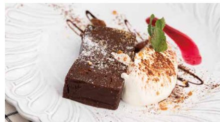
ショコラテリーヌ ¥682(税込 ¥750) Chocolat Terrine しっとり濃厚なチョコレート生地をシャンティとともに...