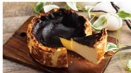
バスクチーズケーキ ¥682(税込 ¥750) Burnt Basque Cheesecake チーズをたっぷり使った濃厚な味わい。 バニラ香る甘さ控えめの大人のチーズケーキ。